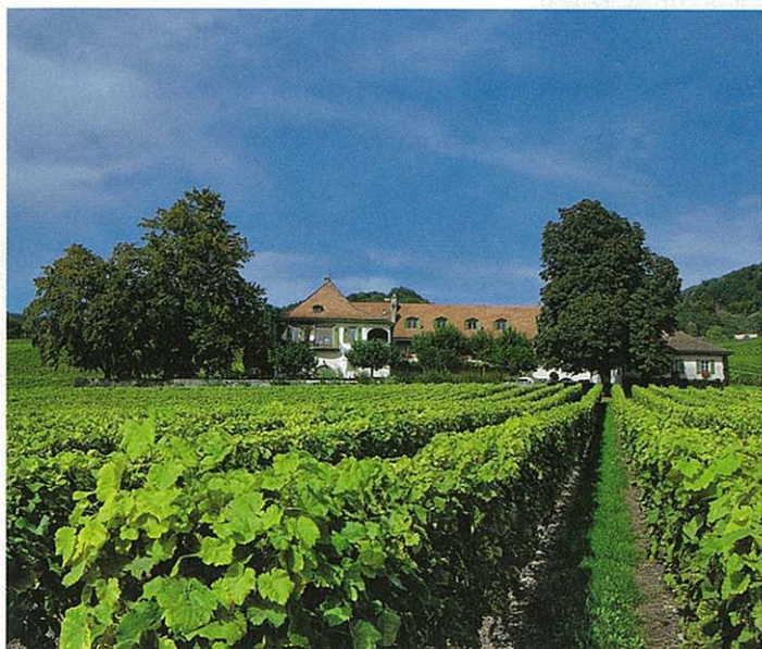
Château de Chatagnéréaz.