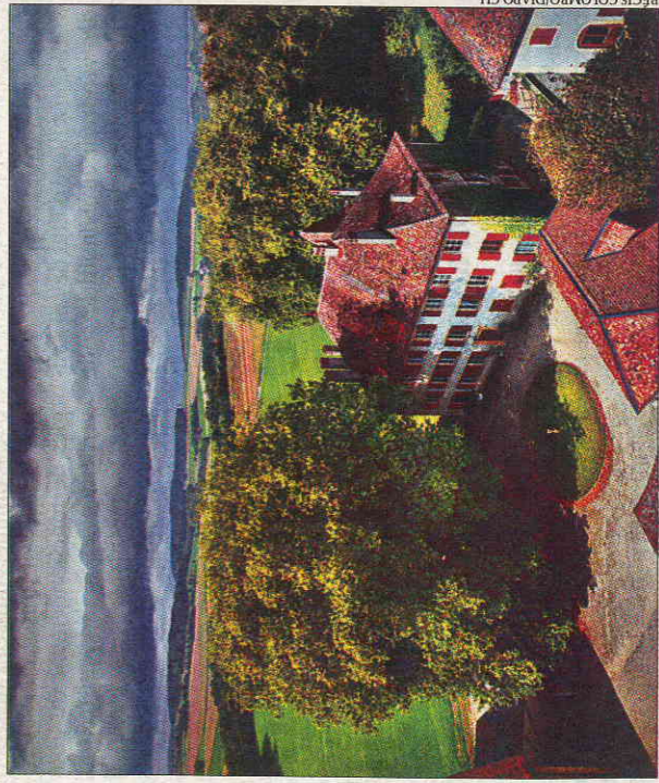
Château d'Éclépens. Une quarantaine de châteaux et d'anciens domaines munis d'un vignoble sont disséminés dans le Pays de Vaud.